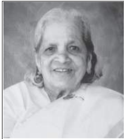
അച്ചമ്മ മർക്കോസ് മണിമലപാറയിൽ ചിങ്ങവനം