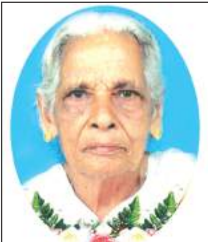
മറിയമ്മ കുരുവിള മുഴിപ്പെരുമേൽ ഐത്തല, ചെറുകുളത്തി, നാന്നി

കരുണനിറഞ്ഞവനെ പുനരുത്ഥാനത്തിൽ നിന്നുടെ സൃഷ്ടിയെ നീ പുതുതാക്കീടണമെ. സന്തപ്ത കുടുംബാംഗങ്ങൾ