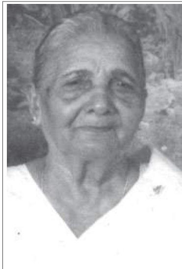
ചിന്നമ്മ തോമസ് പള്ളിക്കപറമ്പിൽ (കുറിച്യ)