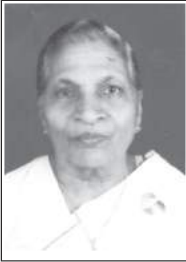
അനമ്മ കുരുവിള തുണ്ടിയിൽ കറ്റോട്