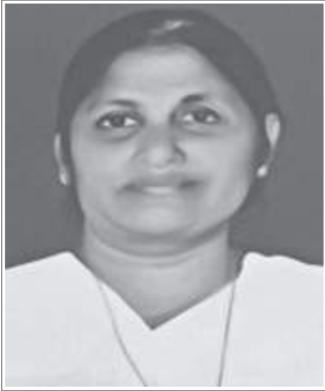
സാറാമ്മ കുറിയാക്കോസ് കുന്നിരിക്കൽ റാന്നി സന്തപ്ത കുടുംബാംഗങ്ങൾ