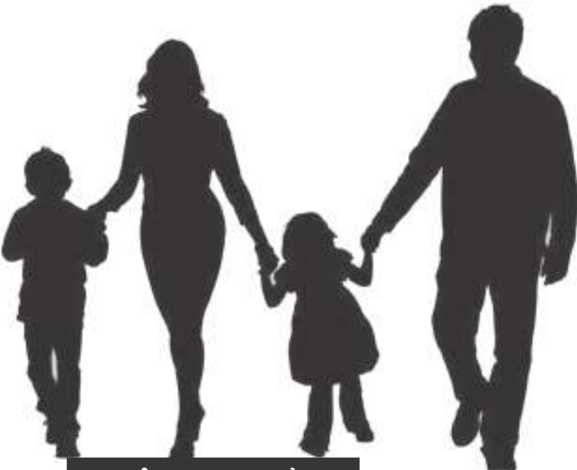
കഴിഞ്ഞ ലക്കം തുടർച്ച