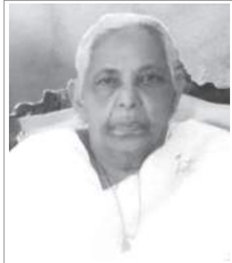
പെണ്ണമ്മ കുറിയാക്കോസ് വൈക്കത്തുശ്ശേരിൽ മാമ്പുഴക്കരി നിന്റെ മഹത്വമുദിക്കും നാൾ നിൽക്കണമിവൾ വലഭാഗത്തിൽ സന്തപ്ത കുടുംബാംഗങ്ങൾ