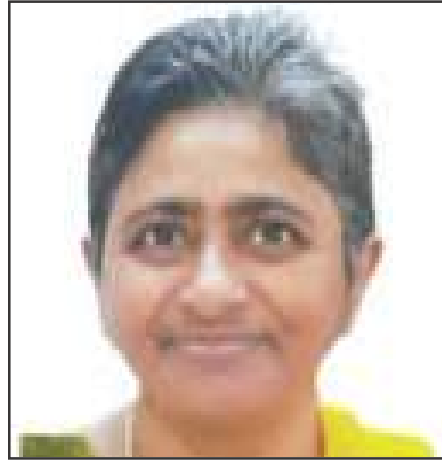
ജയ സാറമ്മ ചാക്കോ തുണ്ടിയിൽ, ഇരവിപേരൂർ

നിന്റെ മഹത്വമുദിക്കും നാൾ നിൽക്കണമിവൾ വലഭാഗത്തിൽ