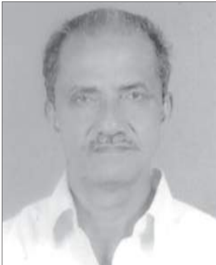
മാത്തുകുട്ടി താഴത്തേതിൽ, കുറിച്ചി

നിന്റെ മഹത്വമുദിക്കും നാൾ നിൽക്കണമിവൻ വലഭാഗത്തിൽ സന്തപ്ത കുടുംബാംഗങ്ങൾ