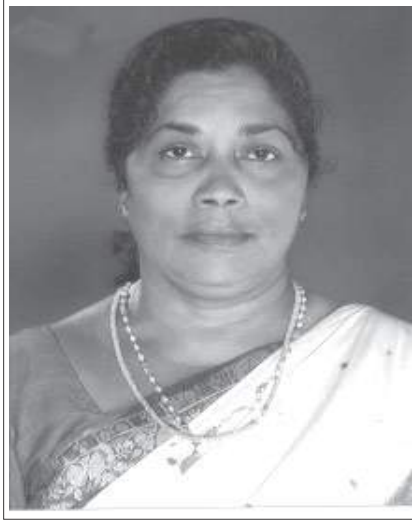
ശോശാമ്മ പുന്നുസ് കോവിലാൽ മഴുകീർ

നിന്റെ മഹത്വമുദിക്കും നാൾ നിൽക്കണമിവൻ വലഭാഗത്തിൽ സന്തപ്ത കുടുംബാംഗങ്ങൾ